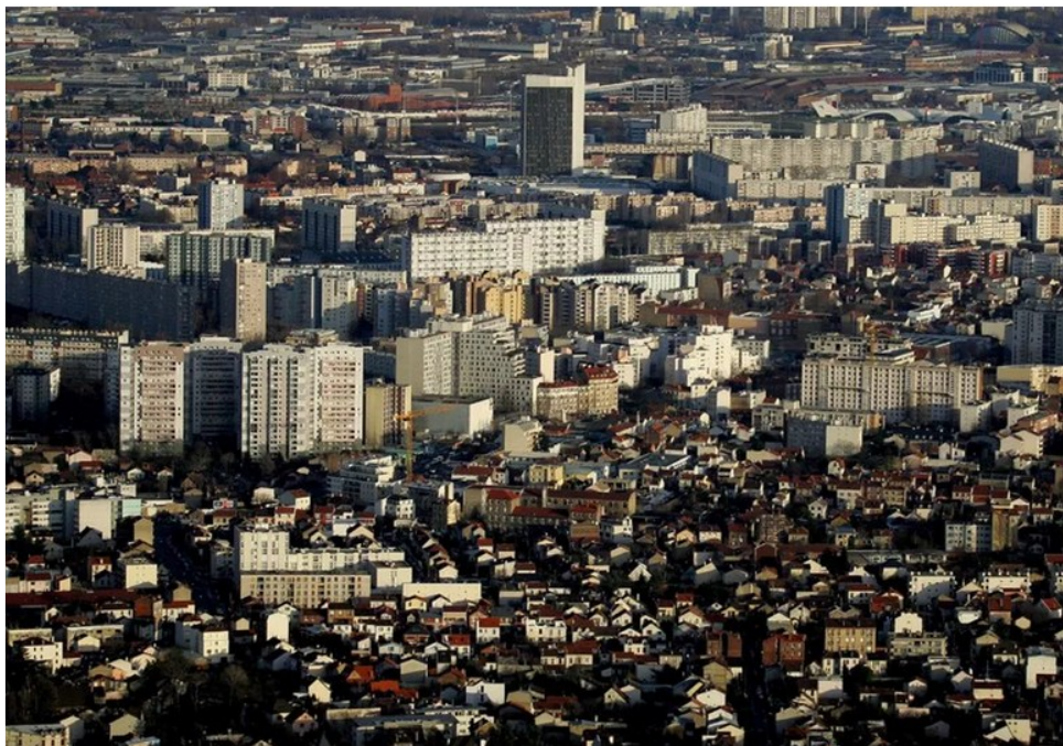
Ville de Gennevilliers